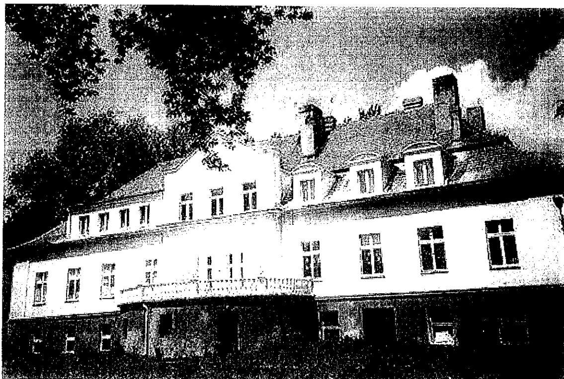
Szczury 2014 r.

„ Zagospodarowanie terenu wokół świetlicy wiejskiej”